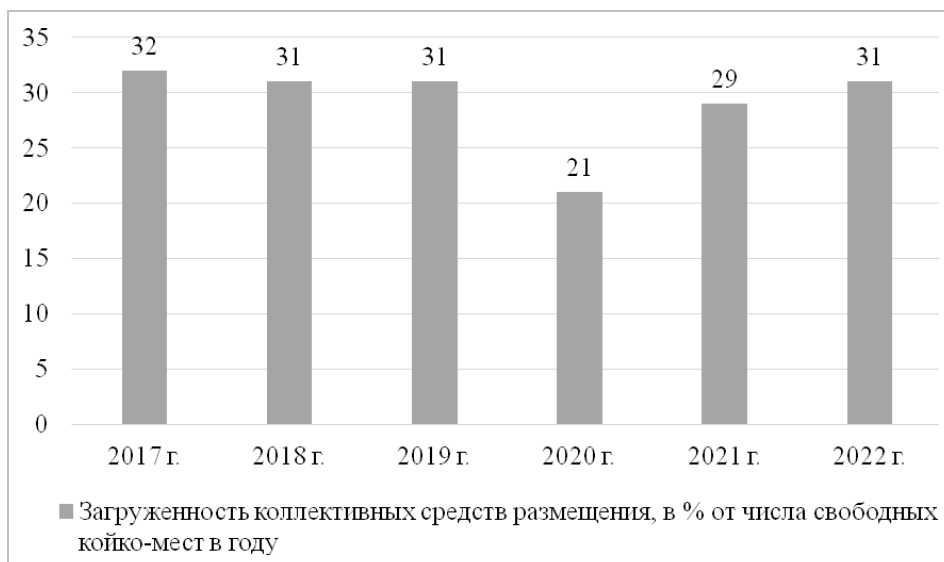
Рис. 2. Динамика загрузки коллективных средств размещения за 2017–2022 гг., в % от числа свободных койко-мест в году Составлено авторами по данным [Туризм ... , 2023]

При всем этом Россия остается перспективным рынком для иностранных брендов из Ирана, Китая, Белоруссии, Армении и других дружественных стран. Сложившаяся ситуация заставила ряд европейских компаний найти возможность остаться на рынке путем продажи российского бизнеса локальным собственникам либо китайским, турецким или арабским холдингам и возобновить работу предприятий под прежними либо новыми вывесками (табл. 2).