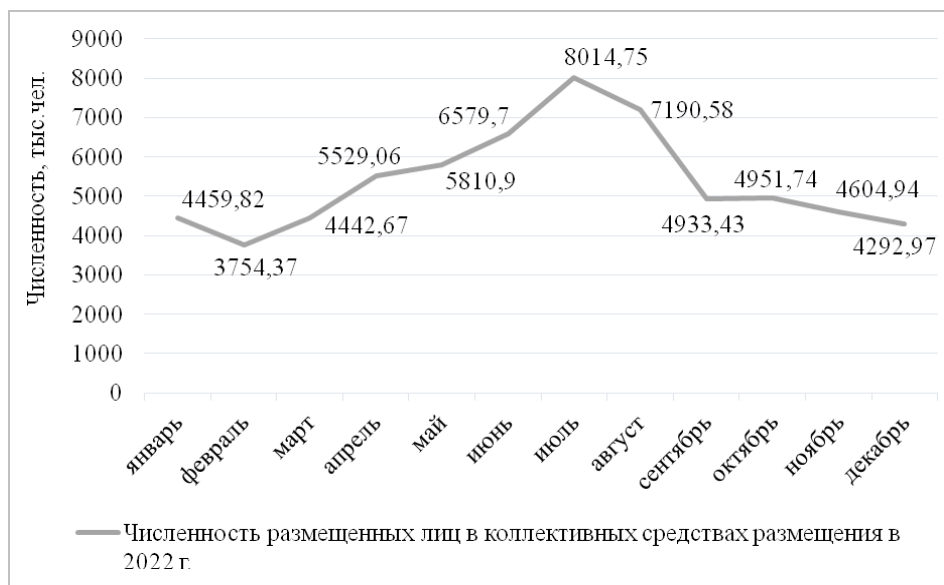
Рис. 1. Изменение численности размещенных лиц в коллективных средствах размещения за 2022 г. Составлено авторами по данным [Туризм ... , 2023]

Динамика загрузки коллективных средств размещения за 2017–2022 гг. представлена на рисунке 2.