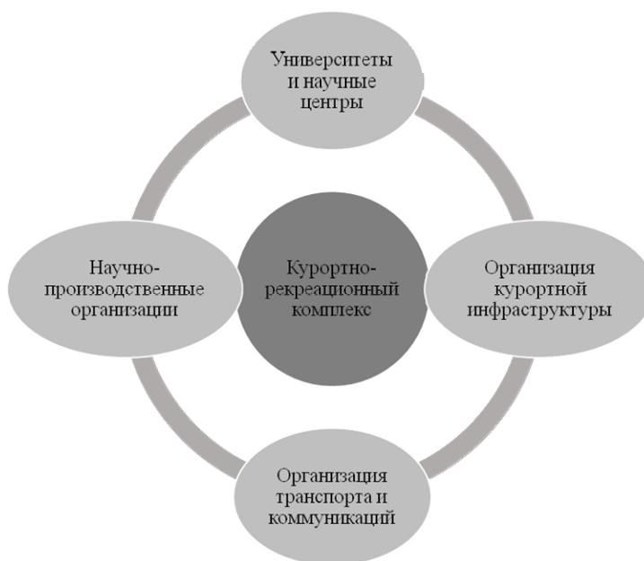
Рис. 3. Организация курортно-рекреационных комплексов по типу технополисов (составлено автором)